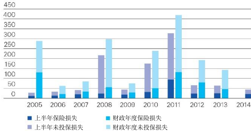
图 1： 灾害损失（10 亿美元）

注： 保险损失 + 未投保损失 = 经济损失