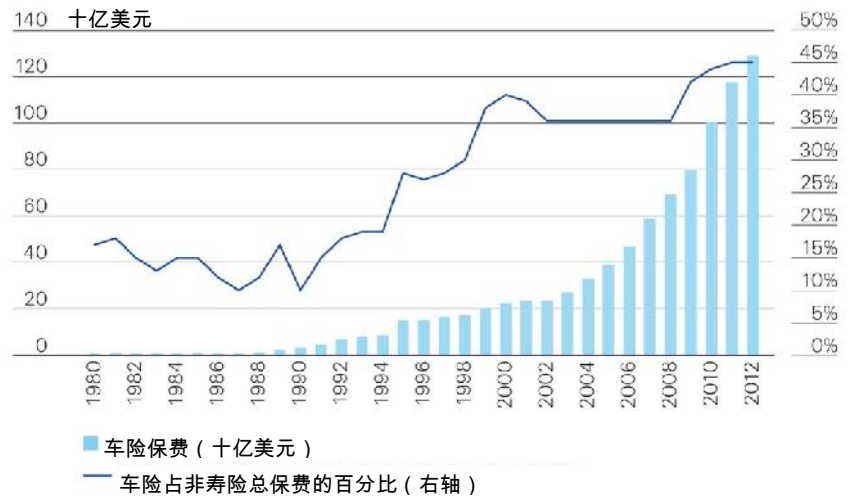
新兴市场的车险保费（十亿美元）及其占非寿险总保费的百分比