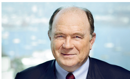
Walter B. Kielholz Président du Conseil d'administration

Les primes acquises et le produit des commissions ont augmenté de 13,7 % à 6,1 milliards USD (contre 5,4 milliards USD au deuxième trimestre 2011). Le ratio combiné du Groupe s'est élevé à 85,7 %. Les fonds propres sont restés essentiellement stables, s'inscrivant à 31,0 milliards USD, contre 31,2 milliards USD à la fin du premier trimestre 2012. Les paiements de dividendes, de 1,1 milliard USD, ont été compensés en majeure partie par les plus-values latentes. Le rendement des fonds propres du Groupe s'est élevé à 1,1 %. Sans la vente d'Admin Re ® , il aurait atteint 14,5 % au deuxième trimestre. Le bénéfice par action s'est établi à -0,12 USD pour le trimestre. Sans la vente d'Admin Re ® aux Etats-Unis, il aurait atteint 3,22 USD. La valeur comptable par action ordinaire a diminué à 87,03 USD, soit 82,38 CHF, contre 87,59 USD, soit 79,17 CHF, à la fin du premier trimestre 2012.