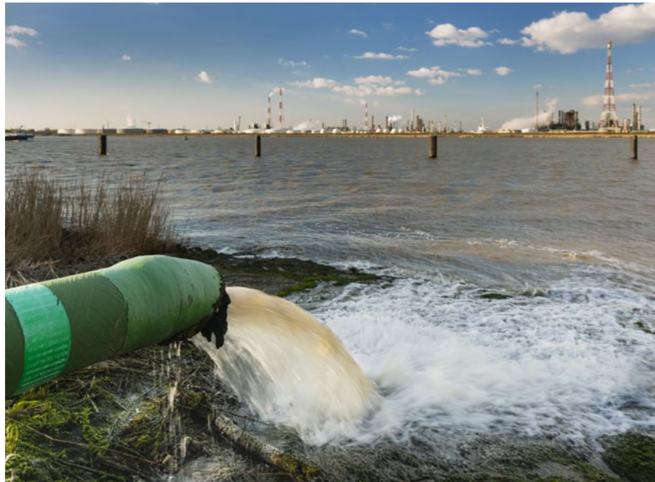
人们越来越重视生态环境问题，并更加关注生态环境污染对经济增长可持续性和个人生活质量的影响。

随着政府将生态文明建设推向新的战略高度，威胁经济可持续发展和人民健康生活的空气污染、河流和地下水以及土壤污染成为了中国社会最重要的议题之一。