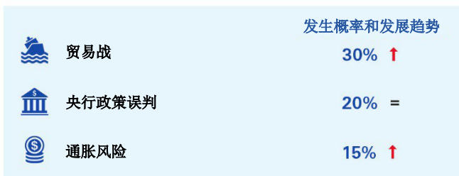
图1：2019年的三大主要风险

近期而言，全球经济增长的下行风险逐步上升。中期来看，美国的超低失业率将会带动更高的薪资增长，进而引发经济过热的风险。这会打乱货币政策正常化发展的基本预期，也会使得美联储的加息幅度高于预期。过度收紧财务状况将会加剧市场波动性，同时导致经济活动放缓。从长期来看，全球经济面临的主要风险仍是中美贸易争端局势的不断升级，进而可能会演变为全球贸易战。报告预测，如果基于最坏的情景假设，即全球所有贸易商品增收10%关税，未来三年全球GDP将下降1.5%-2.5%。