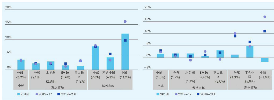
图 2：全球非寿险和寿险保费实际增长率：现实增速和预测增速

此外，许多市场已经发展到保险“S-曲线”比较陡峭的部分，意味着收入增长对保险需求的影响日益上升。